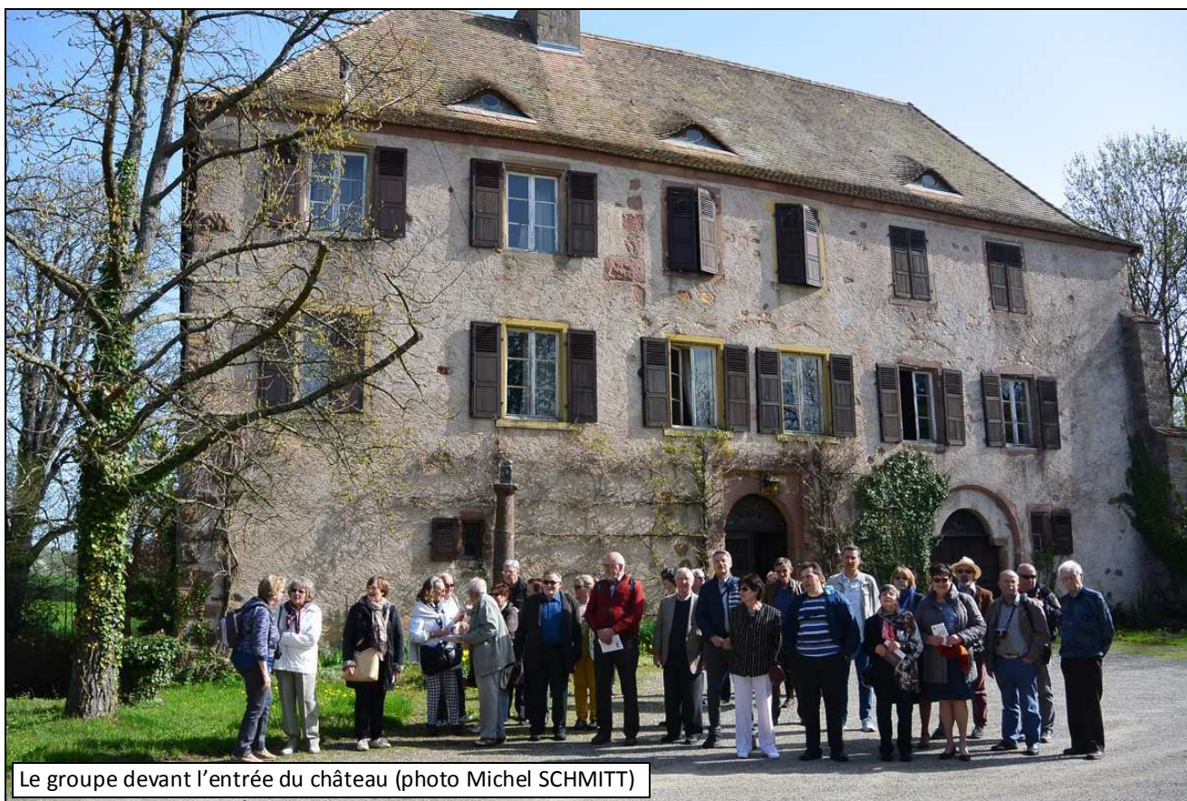
Le groupe devant l'entrée du château

Ndlr : la sixième page du Forum était vide. Plutôt que de laisser une page blanche, nous avons choisi d'y mettre quelques photos prises lors de la sortie du 15 avril.