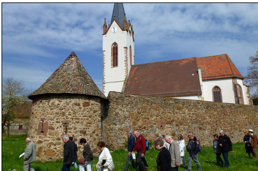
Il ne subsiste que deux cimetières fortifiés en Alsace, celui — très connu — de Hunawihr et celui — totalement méconnu — de Hartmannswiller !