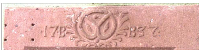
Linteau de porte d'une maison de boulanger (initiales BB 1737).